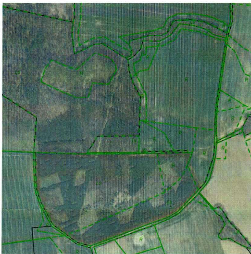
Działka 180 – obręb Gogolewo